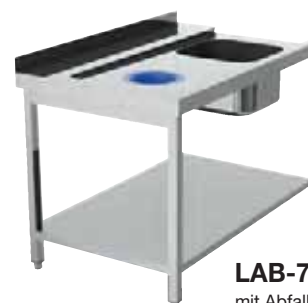
LAB-70-120 mit Abfallschacht

Andere Abmessungen möglich, Preis auf Anfrage.